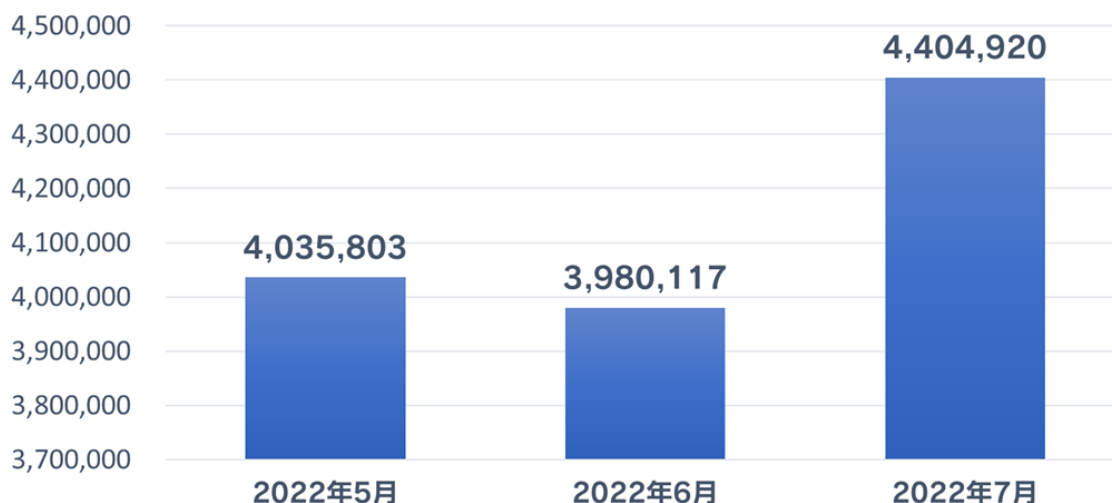
詐欺ウォールによる詐欺サイト検知数(月次比較)

※以下記載のアプリバージョン以上の詐欺ウォールを利用しているお客様のアクセス数値を集計 Windows 版：3.3.0 / macOS 版：3.5.0 / Android 版 1.7.0 / iOS 版 3.2.0.4