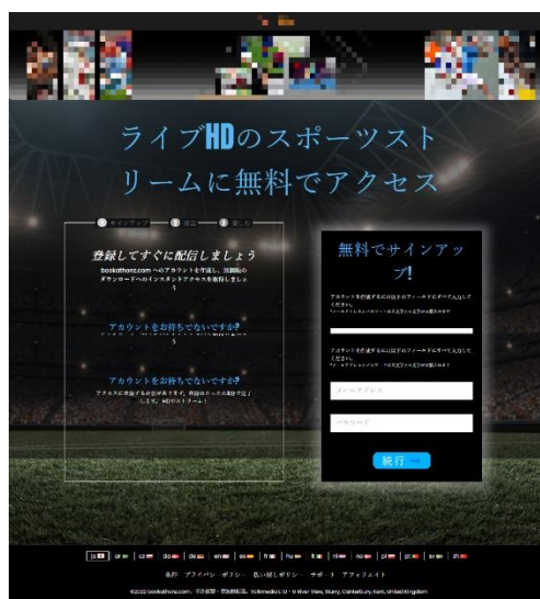
動画視聴詐欺サイト

トの URL が投稿されておりました。11 月は国際的なサッカー大会のイベントがあり、正規サイトのコメント欄にこういったフィッシング詐欺サイトの URL が貼られる可能性もあり注意が必要です。